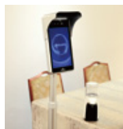
自動検温器設置・消毒液