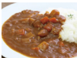
カレーライス & サラダ