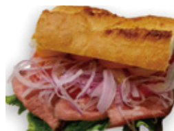
ローストビーフサンド & ポテト